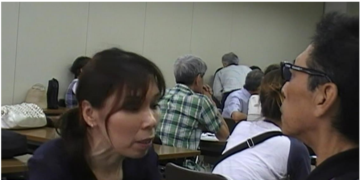
発声カウンセリング会のご案内